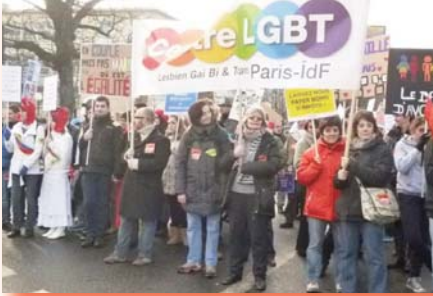
Le Centre LGBT Paris-ÎdF ouvre le 2 e cortège de la manifestation pour l'Égalité des Droits du 27 janvier dernier.